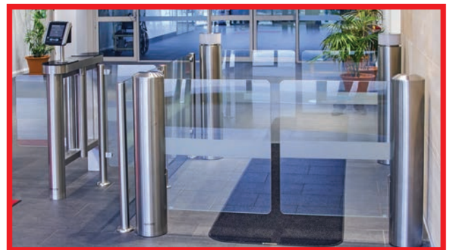
Instalación de dos unidades enfrentadas.